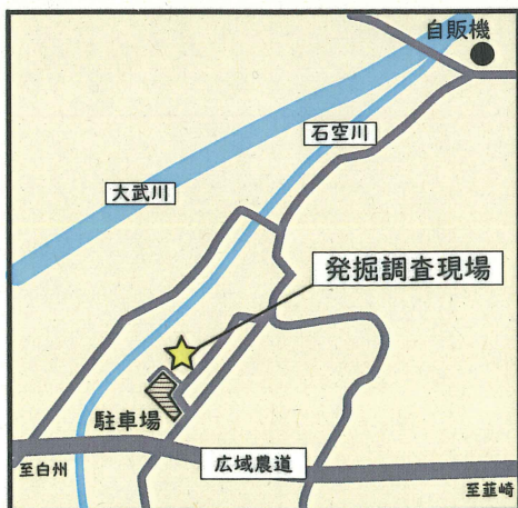
発掘調査現場 拡大図

埜場(ぬたば)遺跡は、縄文時代中期(今から5,000～4,500年前)を主体とする集落跡です。多くの竪穴住居跡や県内でも珍しい配石遺構などが発見され、縄文土器や土偶なども出土しています。地域の歴史を知ることのできるよい機会ですので、ぜひお越しください。