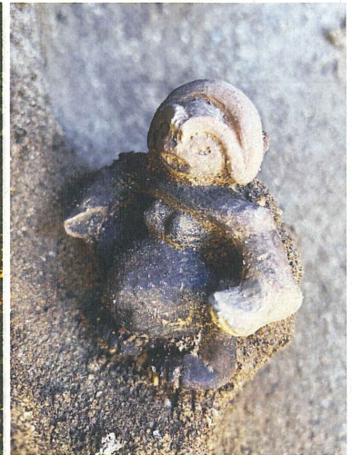
左：調査区全景写真 多くの竪穴住居跡と配石遺構が 発見されています。 上：土偶出土状況 (15号竪穴住居跡)